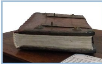
Antiphonaire (18 e s)