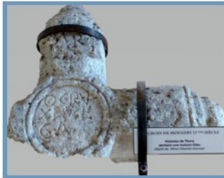
Croix de Moulery (17 e s)