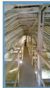
La charpente restaurée