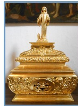
Reliquaire de St Caradeu (17 e )