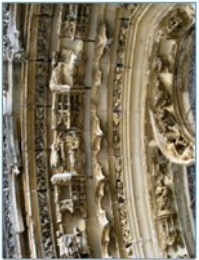
Détail de la voussure du portail

douze groupes sur deux rangs dans les profondes voussures de l'arcade ogivale ou de la courbe intérieure d'une belle et curieuse rose centrale ouverte sur le tympan, la ténuité et la fragilité des feuillages comme ciselés par d'habiles orfèvres ».