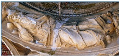
Sous l'oculus du tympan : l'arbre de Jessé (Isaïe 11-1)

L'Annuaire de l'Yonne de 1861 soulignait « l'élégance et la délicatesse de ses sculptures, l'imitation parfaite des plantes, l'agencement des statures formant