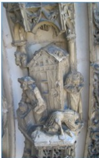
Décollation de St Jean le Baptiste

A l'extérieur, au chevet de l'église, à 3m30 de hauteur, présence d'une bande noire - c'est la litre funéraire - portant les armes du seigneur du lieu à son décès ; sur deux des contre-forts du chevet on