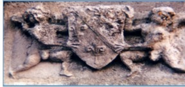
Armes des Anjou-Mézières

578 - Consécration de la paroisse de Thury d'Auxerre par saint Aunaire, 18 e évêque d'Auxerre, lors du synode d'Auxerre.